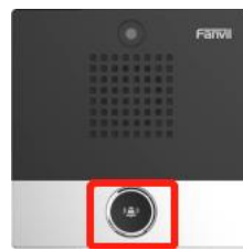
图 2 i10V 速拨键示意图

①当网络环境为可动态获取 IP 时：长按如下图所示按键 3 秒左右（i10D 与 i10SD 请在第一个按键上执行该操作），听到提示音再快速按一下，设备即可播报 IP。